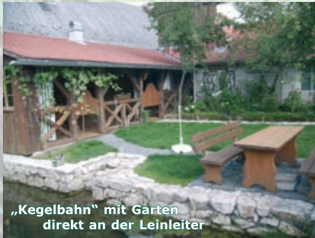
„Kegelbahn“ mit Garten direkt an der Leinleiter