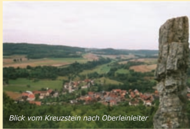
Blick vom Kreuzstein nach Oberleinleiter

Deshalb hat es uns auch sehr gefreut, daß wir bei der Schmuckziegelaktion des Fränkische-Schweiz-Vereins für die Restaurierung ausgezeichnet worden sind. Der Landrat Dr. Denzler schreibt von einer „Zierde für den gesamten Ort“.