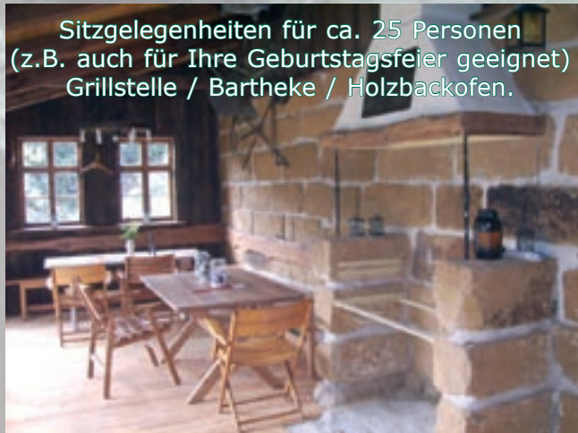
Sitzgelegenheiten für ca. 25 Personen (z.B. auch für Ihre Geburtstagsfeier geeignet) Grillstelle / Bartheke / Holzbackofen.